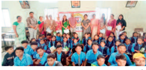
विद्यार्थियों में दंत स्वास्थ्य के प्रति जागरूकता बढ़ाना और नियमित दंत जांच के महत्व को समझाने के लिए किया गया था।