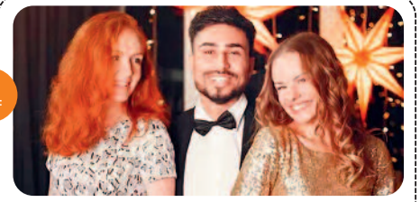
भीड़ में दिखना चाहते हैं अलग, ट्राई कीजिए...